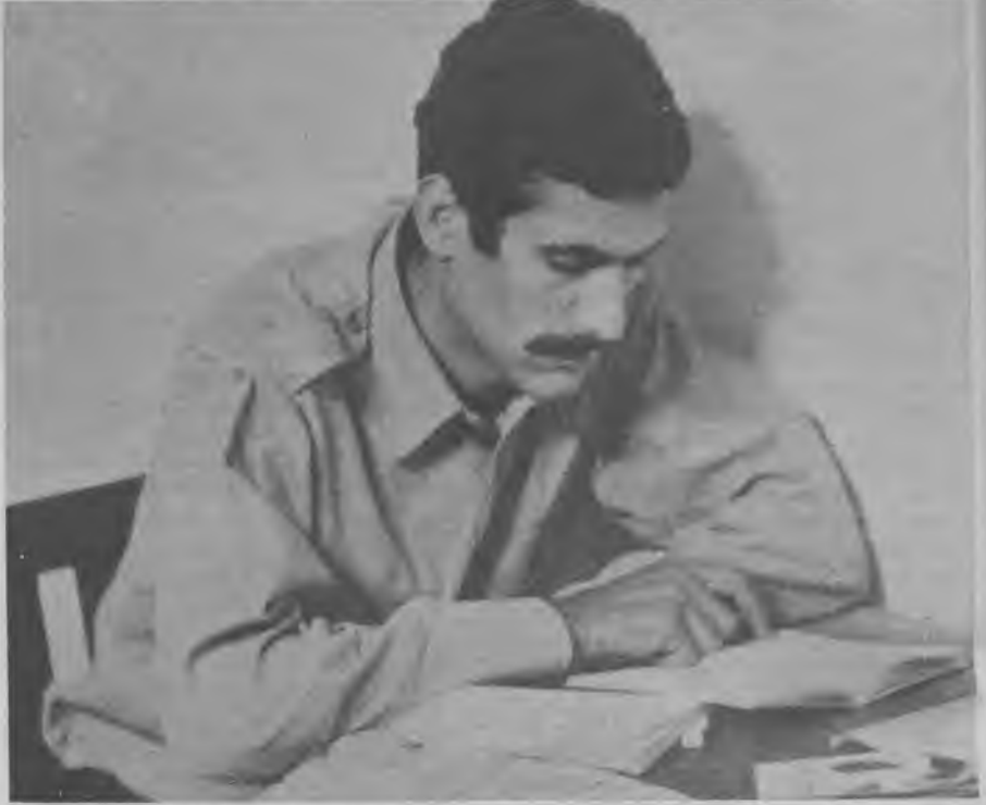
DENİZ GEZMİŞ KİTAPLARININ ARASINDA

"Bir koridora açılan, yanyana sıralanmış demir parmaklıklı hücrelere kapatıldık. Bütün ihtiyacımızı, tepesinde el kadar bir tek pencerenin bulunduğu, bir hücre içinde gö-